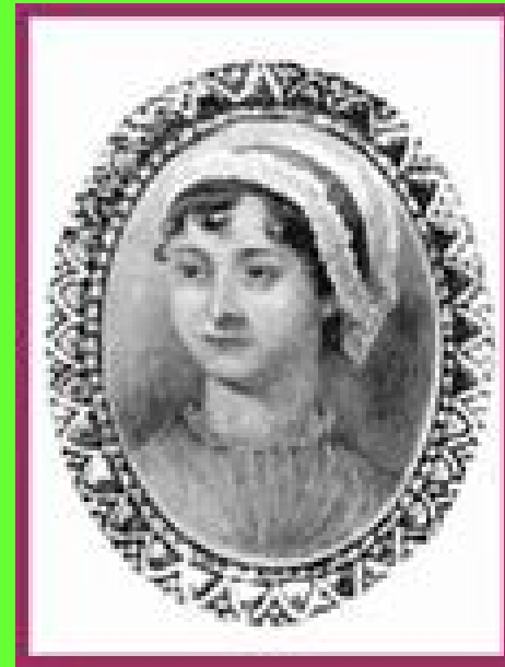
JANE AUSTEN (1775-1817)