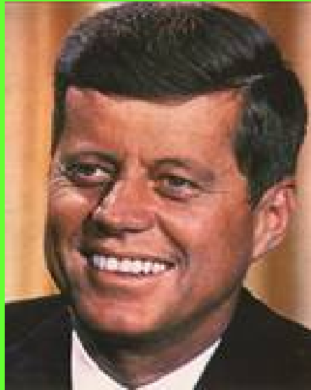
JOHN F. KENNEDY (1917-1963)